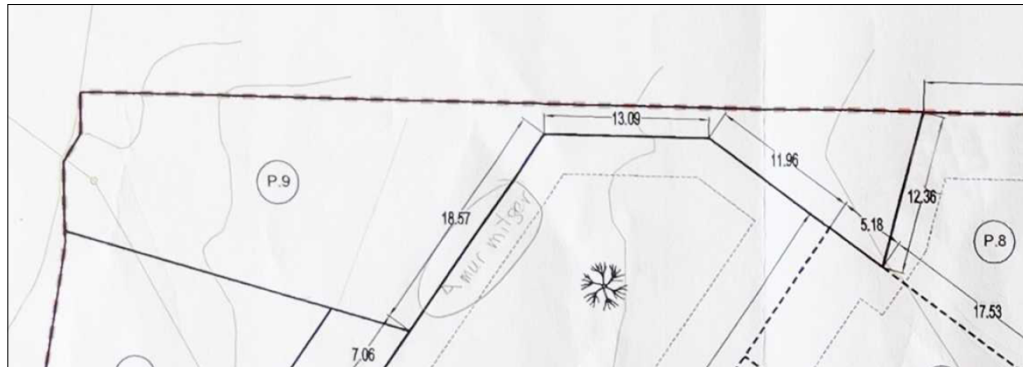
Part del plànol 05– Projecte de reparcel·lació 2008

Així doncs, queda palès que els metres quadrats especificats a la present modificació de la reparcel·lació són els executats realment disposant de 42,33m 2 menys que els projectats, però essent igualment un 9% de l'àmbit de desenvolupament i complint amb l'establert pel planejament