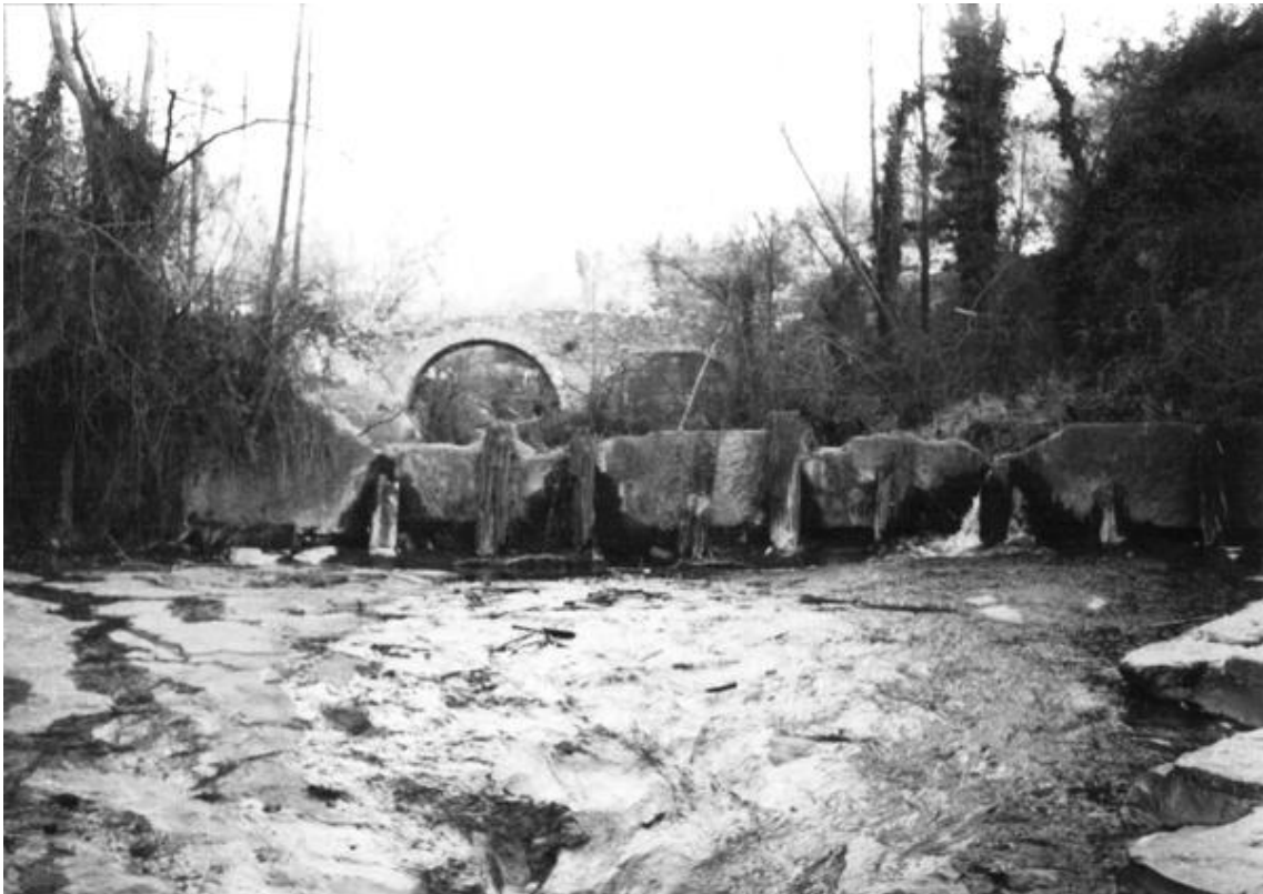
La resclosa del Molí Xic a la dècada de 1980