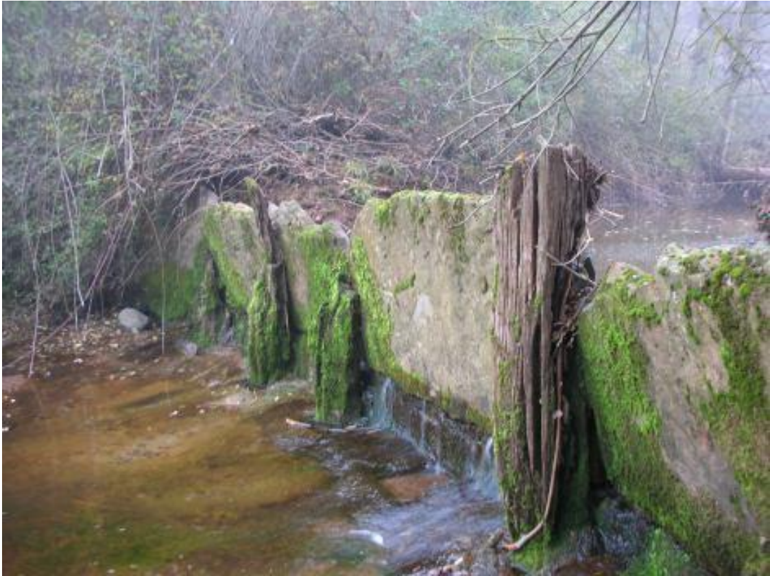
La resclosa del Molí Xic l'any 2019