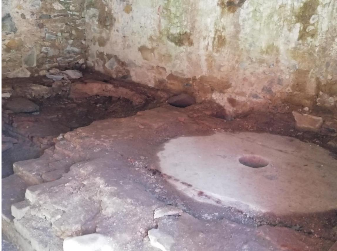
Obrador del Molí Xic

Amb manca a data d'avui de documentació escrita i sense cap informació epigràfica al mateix casal del Molí Xic, només la tipologia constructiva i els paraments de l'edifici permeten apuntar una datació hipotètica del segle XVIII, sense descartar que hi hagués un molí anterior al mateix emplaçament.