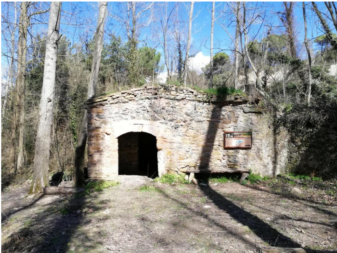
El Molí Xic