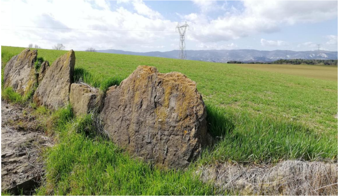
Lloses que delimiten el camí empedrat de Seva