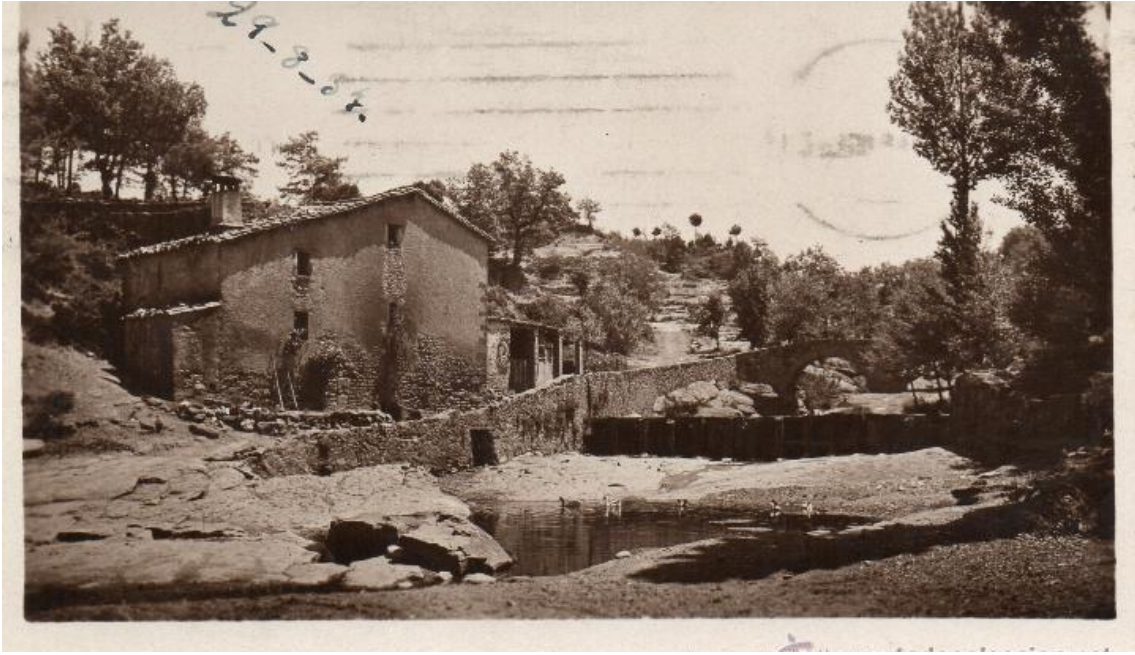
La resclosa del Molí Xic i el Moli dels Sors a la dècada de 1930