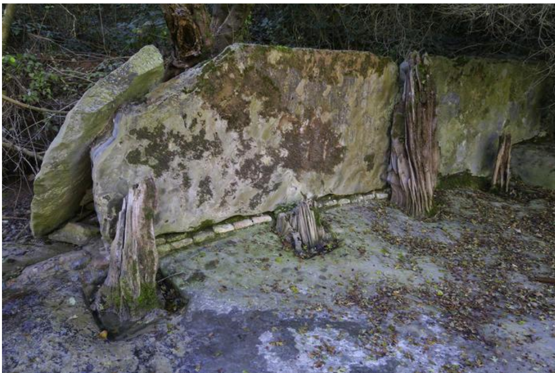
Sistema constructiu de la resclosa (any 2020)

Com a part del sistema hidràulic del Molí Xic i, en especial, atenent a les característiques constructives amb pedra i fusta, la resclosa és un element de gran valor del patrimoni (pre-)industrial tant de Seva (on es troba el molí) com de Taradell pel fet que la llera del riu Gurri actua com a límit entre els dos municipis. Abans de la primera acció destructiva ocorreguda el 2020, atribuïda en primera instància a un episodi d'avinguda torrencial, la resclosa es conservava intacta i constituïa un exemple probablement únic d'aquest tipus d'instal·lació hidràulica. Després que l'Ajuntament de Taradell recuperés algunes lloses aigües i les conservés permetia encara la restauració de la resclosa i la seva activació com element patrimonial representatiu del condicionament històric del riu Gurri.