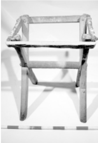
Cabra. Taller de Can Marxant

bona part patrimoni desconegut per les noves generacions davant la ràpida transformació que ha sofert el món rural.