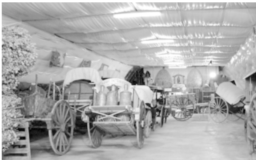
Vista interior de la nau de carros de l'Alzinar de la Roca (Taradell).

re la festa pràcticament fins a desaparèixer. 1