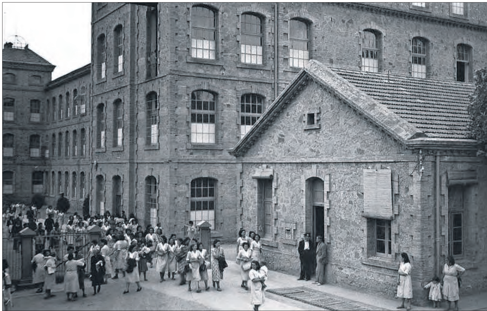
Sortida de les treballadores de la fàbrica de Borgonyà, a Sant Vicenç de Torelló, el 1940