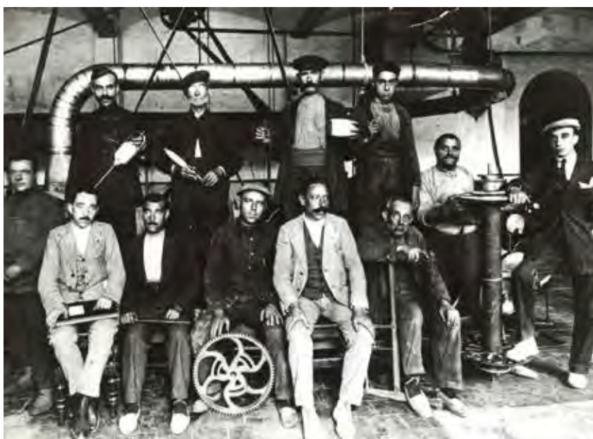
Alguns dels encarregats de la fàbrica de can Riva (Les Masies de Voltregà) l'any 1918. Tots són homes, i tots mostren l'eina que els identifica amb el seu "ofici".

Dins la fàbrica, les treballadores s'ocupaven sobretot de la part final del procés, és a dir de la filatura i trescanat. Filadores, ajudantes i sobreres eren les responsables de portar les contínues, aspís, dobladors o coneres. També treballaven en l'estiratge, amb els manuars i les metxeres. Però rarament s'ocupaven de l'inici del procés. A la preparació, els responsables de portar els batans i cardes eren exclusivament els homes. On tampoc hi havia dones era fent les feines més especialitzades: fuster, turbinaire, corronaire, mecànic o escrivent eren oficis exercits exclusivament per homes, ja que era impensable que les dones rebessin la formació adient per exercir-les. On segur que tampoc hi havia dones era en els estrats més qualificats de l'estricta jerarquia fabril: majordoms, encarregats i directors eren des de sempre i mentre van durar les fàbriques, únicament homes. Així doncs, malgrat la complexitat d'algunes màquines i el coneixement i destresa necessaris per utilitzar-les, les feines desenvolupades per les dones dins la fàbrica eren titllades de poc qualificades. Una consideració molt útil a l'hora de justificar uns salaris més baixos en comparació als dels seus companys. Respecte a la jornada laboral, no hi havia diferències