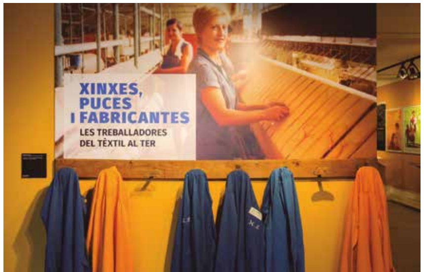
L'exposició es va poder veure al Museu del Ter del 7 de març al 3 de juny de 2018.

Amb l'exposició "Xinxes, puces i fabricantes. Les treballadores del tèxtil al Ter", el Museu del Ter continua dirigint la seva mirada cap al ric patrimoni industrial de casa nostra i en aquest cas, per centrar-se en les seves protagonistes: les treballadores. Des de fa uns anys, el paper de les dones del tèxtil ha estat un dels centres d'atenció del Museu del Ter amb la voluntat de revertir el menyspreu del seu paper històric i reivindicar-ne la memòria com un dels motors de la història industrial del Ter.