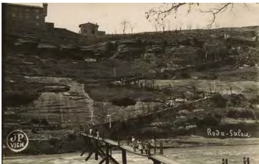
Camí i palanca de la colònia de Salou (Les Masies de Roda). Arxiu Josep Maria Cervera, Roda de Ter

Amb aquesta exposició, el Museu del Ter ha volgut reivindicar la memòria de les milers i milers de dones (i nenes) que van ser un dels motors, sens dubte, de la història industrial del Ter a canvi d'un sou sempre inferior al dels homes. Exèrcits de filadores, sobreres, aprenentes... als aspis, a les metxeres, a les contínues, a les coneres... En innumerables tasques, sovint menystingudes i en l'escalafó més baix de la jerarquia laboral. Però al cap i a la fi imprescindibles. Imprescindibles sostenint l'edifici de la indústria tèxtil del Ter sovint en torns de nit i també durant una segona jornada laboral, en la qual aquelles mateixes dones, esposes, mares o filles, cuinaven, netejaven, rentaven la roba i cuidaven la resta de la família, especialment els fills i filles durant gairebé 200 anys. Xinxes o heroïnes?