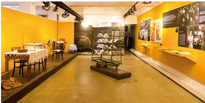
Una sèrie de fotografies i objectes relacionats amb l'àmbit domèstic, et feien notar que les dones eren les úniques responsables de portar la casa.

amb cert regust gremial dins la fàbrica), tot substituint-los per filadores. És a dir, una mà d'obra molt més avantatjosa des del punt de vista dels empresaris, essent molt més barates i dòcils.