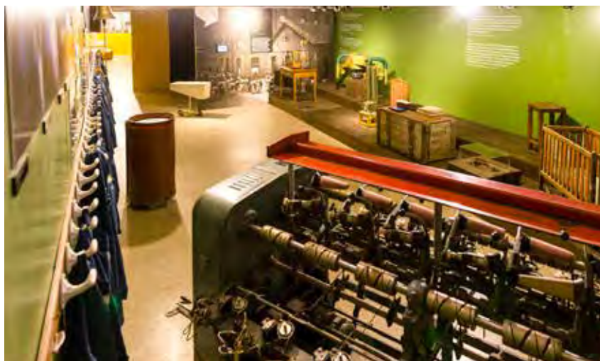
L' àmbit que tractava la "dona a la fàbrica" mostrava un munt de fotografies de treballadores a l'interior de les diferents fàbriques del Ter, i objectes relacionats amb la filatura.

normalment deixaven la fàbrica per dedicar-se exclusivament a la masia. Del que no hi ha dubte és que les fàbriques estaven plenes de dones, i inevitablement anar a treballar a la fàbrica implicava un desplaçament. Un recorregut protagonitzat sobretot per grups de dones, sovint molt ben organitzats i que creixien a mesura que s'acostaven al destí. Durant el trajecte parlaven, resaven, cantaven, de vegades festejaven i sovint esquivaven la vigilància masculina. Amb els anys aquestes dones van donar forma i fins i tot identitat a alguns camins. És el cas, per exemple, del "camí de la paciència" que unia Sant Pere de Torelló amb les fàbriques de Vila-seca i Borgonyà. Més tard, a partir de la segona meitat del segle XX,