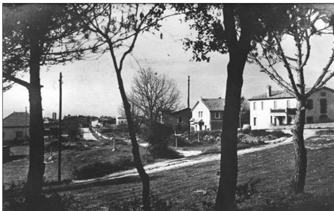
La Torre Sant Genís, la segona casa a la dreta.