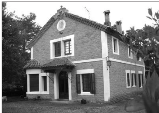
La Torre Sant Genís (Taradell) el 2018.