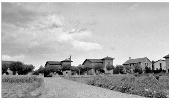
Les torres de l'avinguda Bon-Oreig, a la primera meitat dels anys cinquanta.