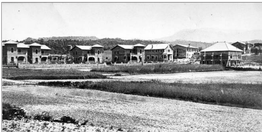
La fotografia més antiga de la Torre Sant Genís (Hospital de refugiats).