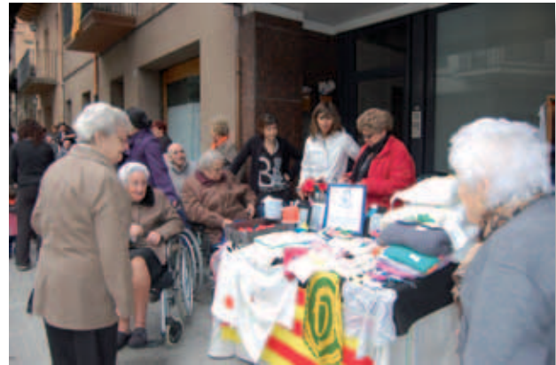
Sant Jordi parada al poble.