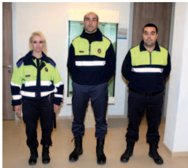
Membres del cos de Vigilants locals de Taradell.

Per portar a terme el servei, el cos està dotat d'un vehicle tot terreny que substitueix el que hi havia fins ara i que havia finalitzat la seva vida útil. També disposen de telefonia mòbil, emissora per emergències, terminals portàtils per cursar denúncies telemàticament, equipament per capturar animals de companyia i tots els elements necessaris per prestar ajuda a la via pública a les persones que ho necessitin.