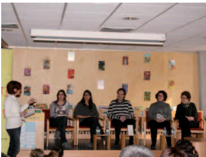
Acte de presentació del projecte Nascuts per Llegir.

I quin és el pla d'acció del projecte? Des del CAP, a través de les visites periòdiques de revisió, transmeten a les famílies la importància de la lectura per al creixement dels nadons i les conviden a participar del projecte, entregant informació de l'NPL i de la biblioteca i unes receptes de lectura molt especials, amb recomanacions de llibres, contes i pautes per a llegir amb els infants. A la biblioteca, la mare o el pare inscriu el nadó al projecte, li fan el carnet d'usuari/ària i li ofereixen espais agradables, bons materials, consells i activitats interessants especialment per a nadons de 0 a 3 anys que podran compartir amb els seus pares i mares.