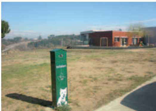
Contenedor de recollida d'excrements.

També s'han habilitat quatre espais públics per passejar els gossos sense cadena, sempre sota la responsabilitat de la persona propietària, on els animals poden fer les seves necessitats que s'han de dipositar en contenidors adequats. S'ha col·locat un total de set contenidors de recollida d'excrements. També s'han senyalitzat les zones públiques del municipi amb l'accés prohibit als animals de companyia.