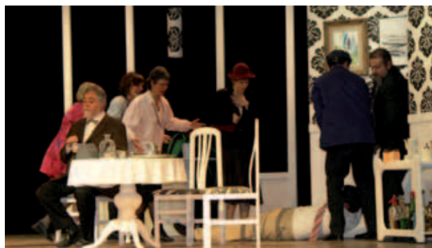
Actuació de l'Associació de Sant Tomàs.

La valoració que se'n fa és molt positiva, tal com ho demostra el volum de públic que registra any rere any.