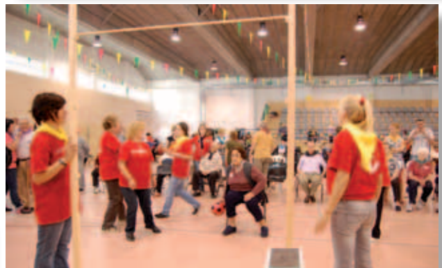
Olimpiades a Casserres.