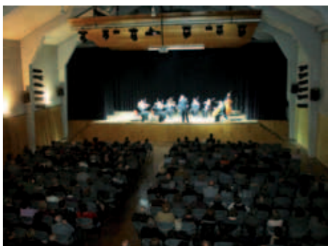
Concert Orquestra de Cambra de l'Empordà.