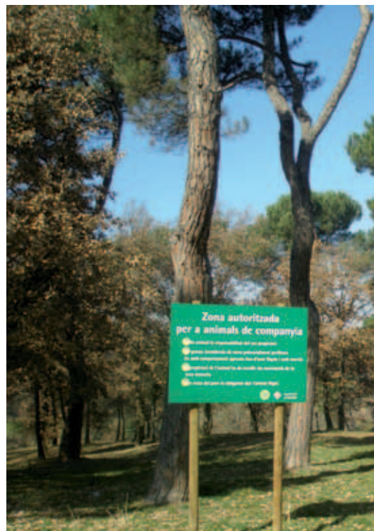
Espai del Pujaló.