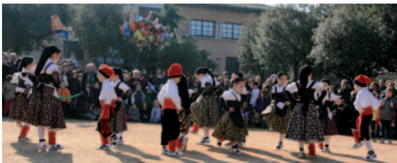
Festes de Sant Sebastià.