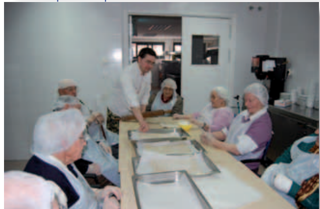
Taller del xocolater.