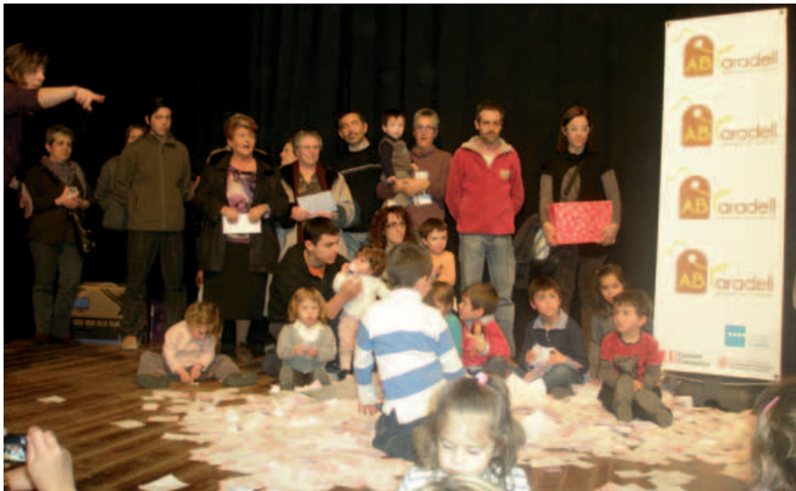
Acte de lliurament dels premis de la campanya de dinamització comercial.

El sorteig de les entrades va tenir lloc el dia 20 de gener, a les 6 de la tarda al Centre Cultural Costa i Font, coincidint amb una de les activitats programades amb motiu de la festa de Sant Sebastià.