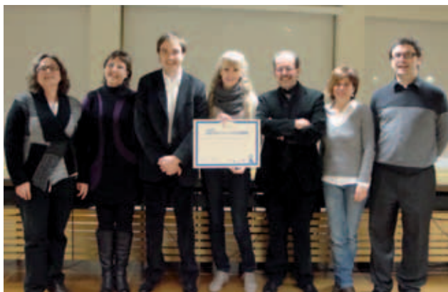
Acte de lliurament del premi Ajuntament de Taradell.

A ella i a tots els participants la nostra enhorabona !