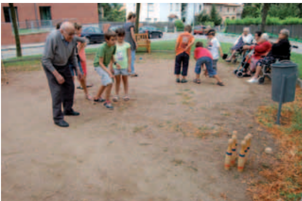
Taller de jocs antics avis/nens.