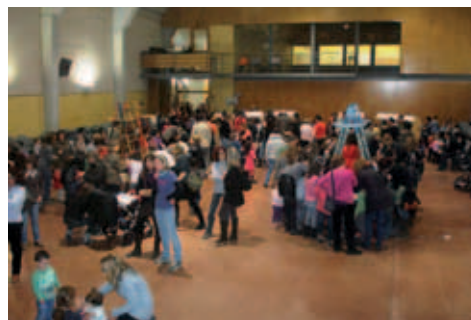
Festes de Sant Sebastià.