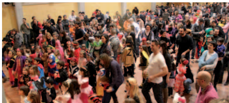
Celebració del carnaval infantil al Centre Cultural Costa i Font.