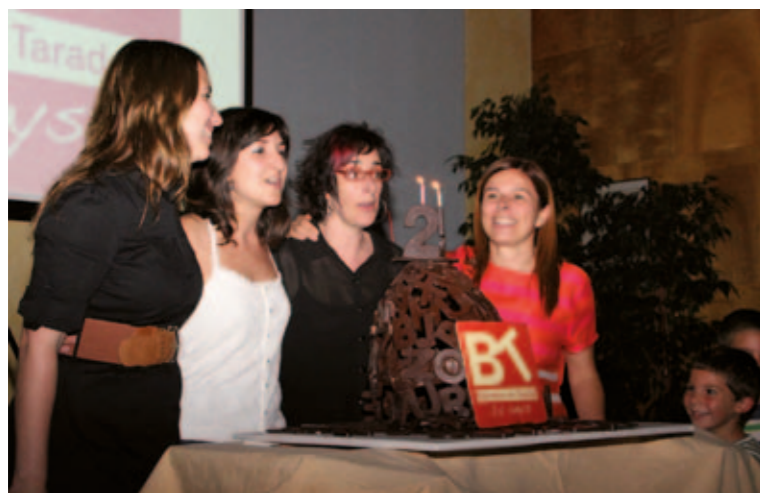
Celebració del 25è aniversari de la Biblioteca L'Equip de la Biblioteca bufant les espelmes del pastís

Gràcies a tots els usuaris per aquests 25 anys!