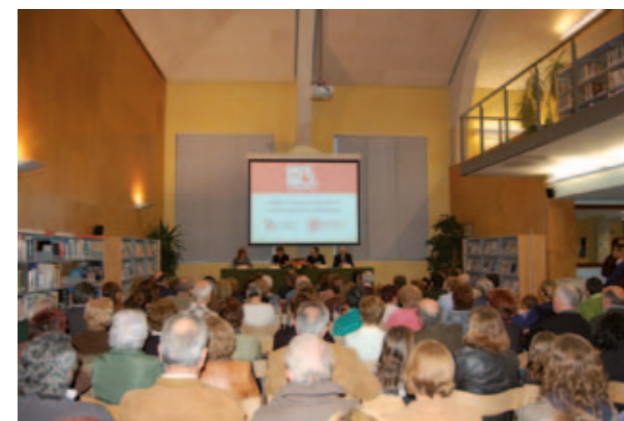
Acte d'inauguració de les obres d'ampliació de la biblioteca

L'any passat aquest projecte es va dedicar a Escòcia i aquest 2012, a la Provença.