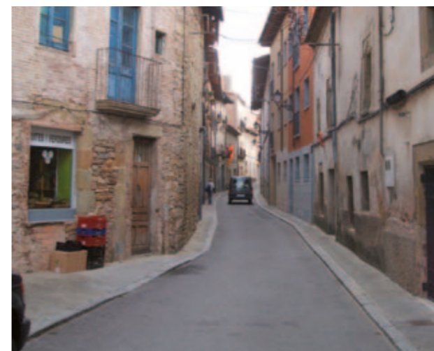
Carrer de la Vila