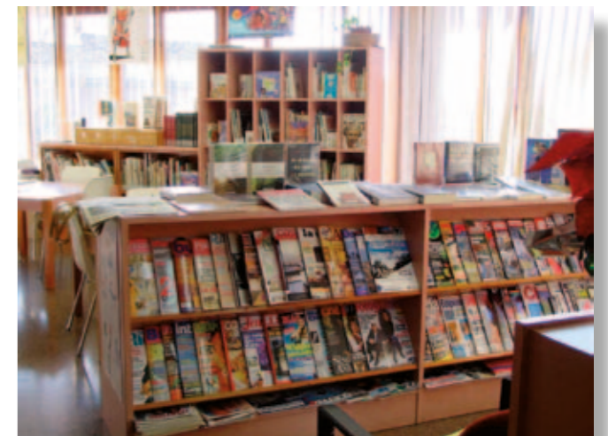
Secció de revistes de l'antiga biblioteca

I així comença la història de la biblioteca. La missió de la biblioteca era, i és, oferir als taradellencs accés a la informació, a la cultura i a l'autoaprenentatge.