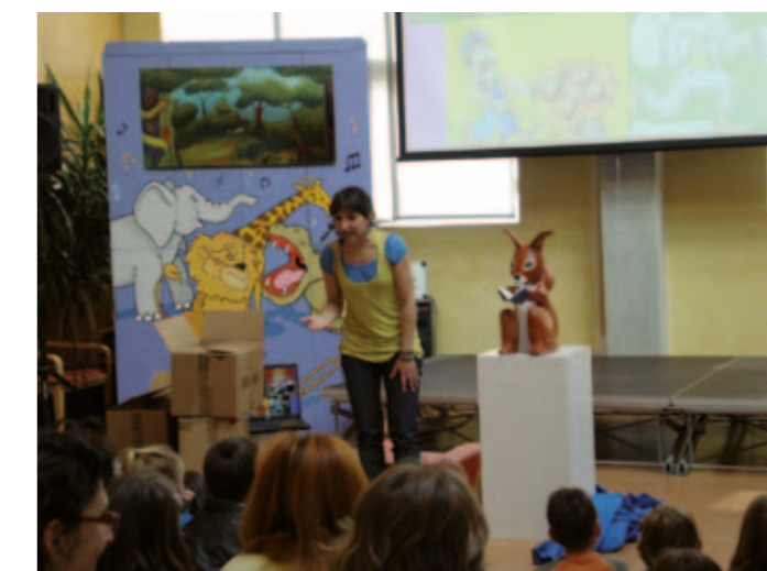
En Sebastià, mascota de la sala infantil

Actualment la biblioteca té un fons de 33.000 volums , rebem unes 38.000 visites anuals i deixem gairebé 25.000 documents en préstec. El darrer any hem programat unes 80 activitats. L'any 1991 la biblioteca va rebre 9.285 visites i va deixar en préstec 4.512 llibres.