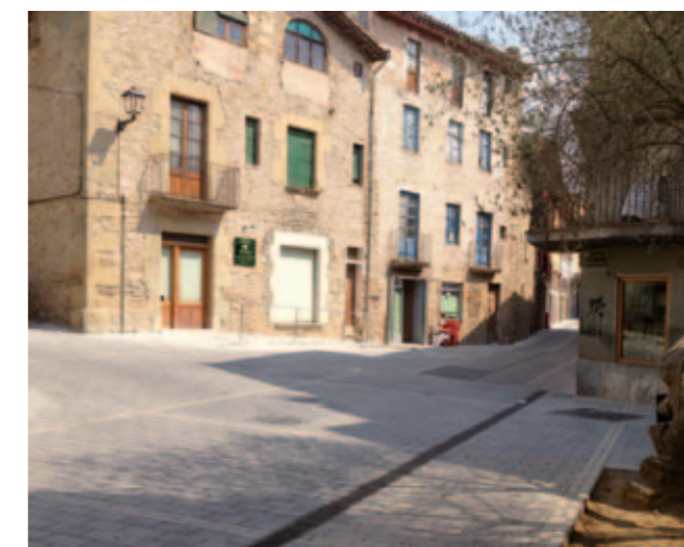
Carrer de l'Església