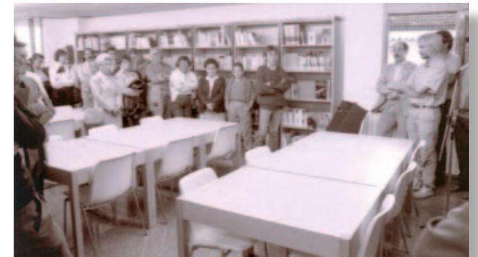
4 de juny de 1987. Inauguració de la biblioteca

Pocs dies abans de la inauguració, quan el local i el mobiliari van estar a punt, un equip de persones del Servei de Biblioteques va desempaquetar els 4.000 volums i els va col·locar ordenadament a les prestatgeries seguint la classificació decimal, l'ordenació universal que utilitzen les biblioteques. La tarda del 4 de juny, amb els parlaments de les autoritats, la Biblioteca Popular de Taradell quedava oficialment inaugurada i llesta per oferir els seus serveis als taradellencs.